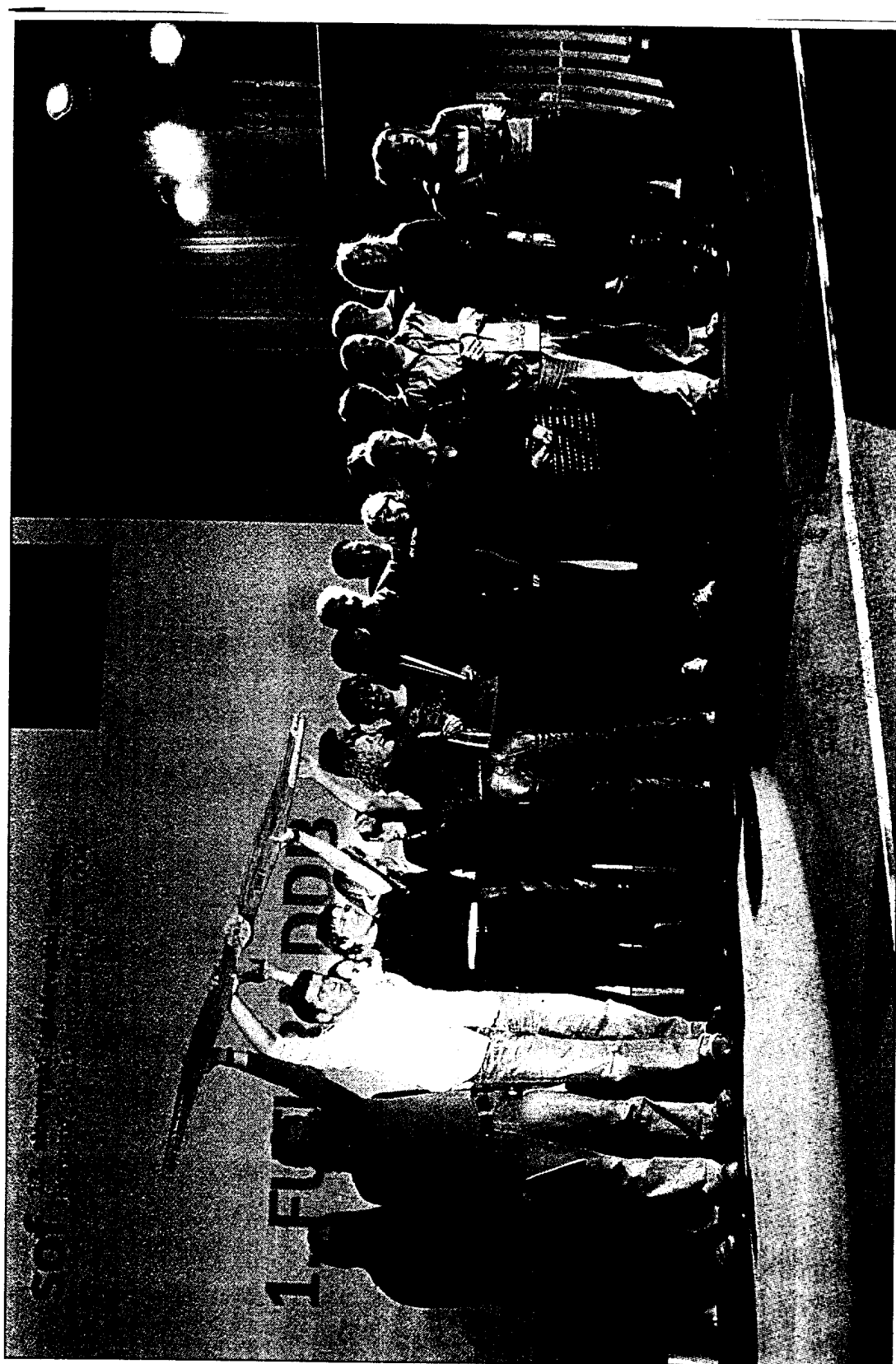
Agencija leta 2003 – Futura DDB je naziv agencije leta osvojila z veliko nagrado za radijski oglas Nori nakupovalec za Poli, zlatimi priznanji za tv-spot Poli padalec in celostno akcijo za Poli, serijo tiskanih oglasov za National Geographic, Murrin katalog Jesen-zima, samopromocijski prospekt ter štirimi srebrnimi priznanji.