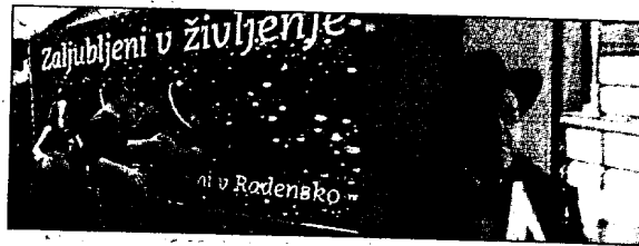
Najboljša celostna akcija festivala, Studio Marketing JWT

znam. Delajo zelo dobro in si zaslužijo, da so tolikokrat agencija leta.«